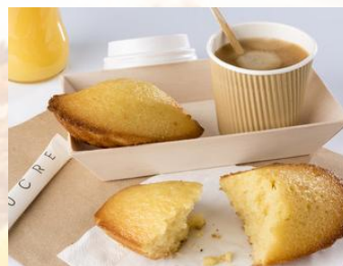
MADELINE PUR BEURRE 23% d'œufs frais et 22% de beurre pâtissier. Pièce de 45g / Colis de 70 pièces Réf. 235113