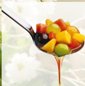
SALADE de FRUIT ACAPULCO Fruits en proportions variables : ananas, mangue, pêche jaune, mangue, melon orange, melon vert. Sachet de 1kg / Colis de 5 sachets Réf. 111633