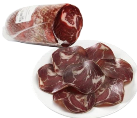
½ COPPA SEL SEC PORC ORIGINE FRANCE Demi-pièce de 1,4kg Réf. 200907