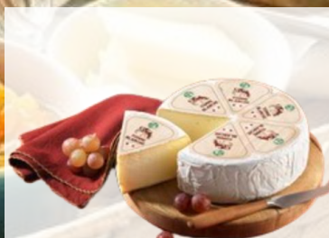
TOMME BLANCHE Lait pasteurisé de vache à pâte molle LAIT ORIGINE France Pièce de 2kg Réf. 112361