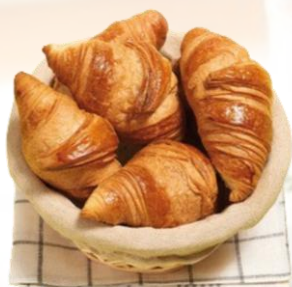
CROISSANT PAC au BEURRE CHARENTES POITOU Pièce de 80g / Colis de 60 pièces Réf. 100193