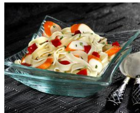
SALADE de TAGLIATELLES AU SURIMI Composée de tagliatelles accompagnées de surimi, poivrons rouges, ciboulette et estragon. Le tout relevé d'une sauce mayonnaise. Barquette de 2,5kg Réf. 30244