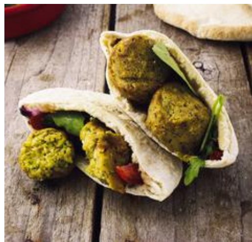
FALAFEL FÊVES MENTHE & CORIANDRE Préparation cuite à base de pois chiches, fèves, menthe et coriandre. Pièce de 20g / Sachet de 2.5kg / Colis de 2 sachets Réf. 104188